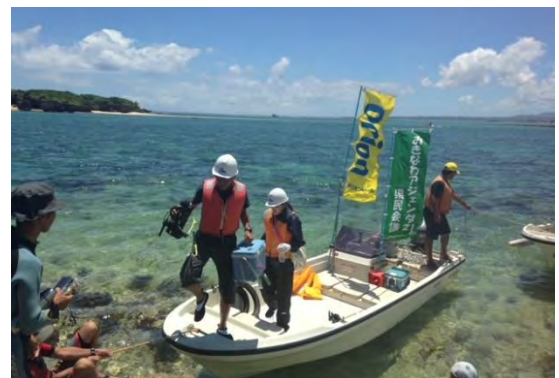
ジュゴンの取材に来た、テレビクルーのみなさん