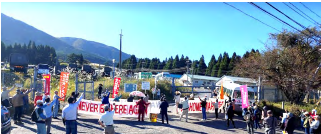
70人近くが参加した抗議集会

こんな集会を持たなくてもよくなるのが一番ですが、また集まらないといけない時は、一緒に参加してみませんか？元気をもらえますよ！！(むねよしまこと)