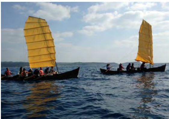
2015年、サバニ(南西諸島で古くから使われていた漁船の名称)で海上抗議行動