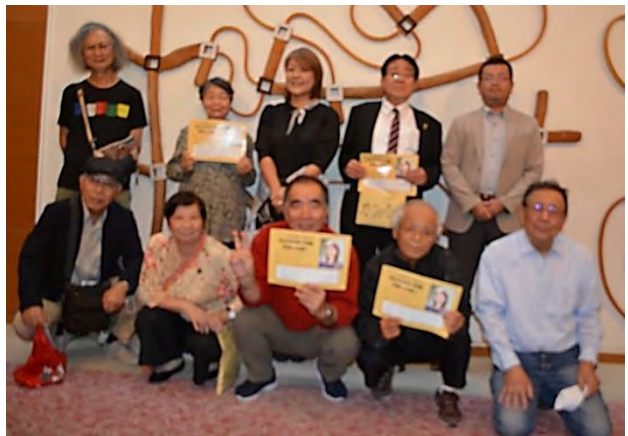
講演会終了後、みんなで記念写真。後列真ん中が三上監督。監督はこの後の新幹線で、岡山に向かわれました