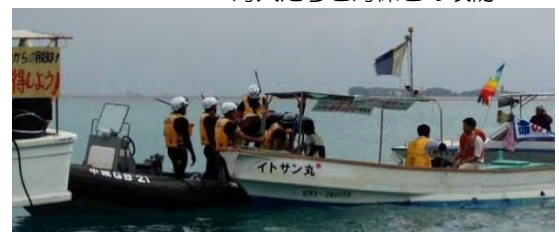
海人たちと海保との攻防