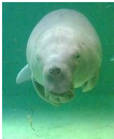
現在唯一飼育されている、鳥羽水族館のジュゴン