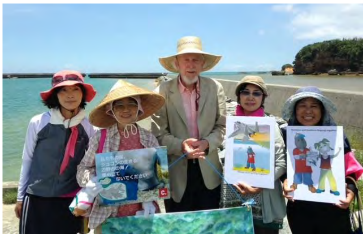
2014年に来沖されたガヴァン・マコーマック博士(オーストラリアの歴史学者)を迎えて、仲間とジュゴンの海を案内。