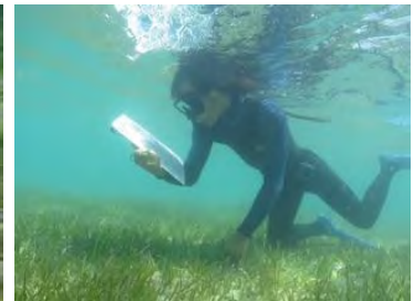
食み跡の調査の様子