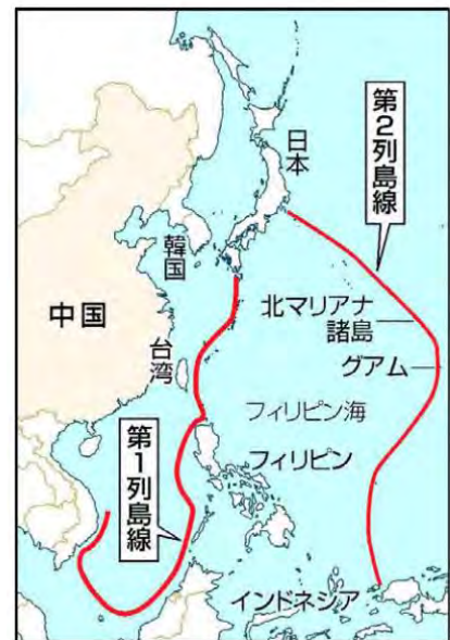
第一列島線と、第二列島線

与那国島に 電子戦部隊が来ることが決まった。ミサイル基地ができることも決まった。ものすごく巨大な軍港も作られるということで、これは大浦湾に匹敵する大工事になっていく。こうやって島が潰されていく。