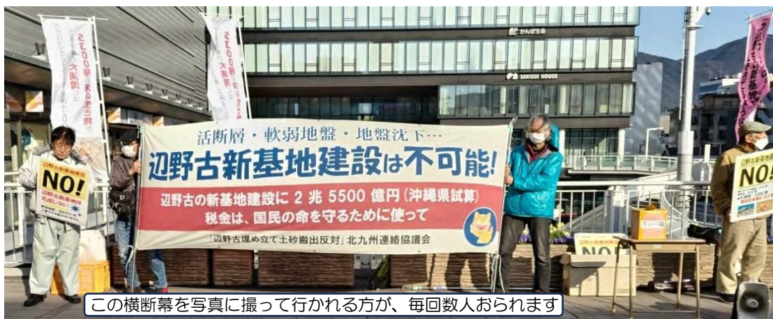
この横断幕を写真に撮って行かれる方が、毎回数人おられます

熱かったり寒かったり、演説原稿がなかなか出来上がらなかつたり、それなりの苦労もありますが、これからも毎月続けていきたいと思っています。