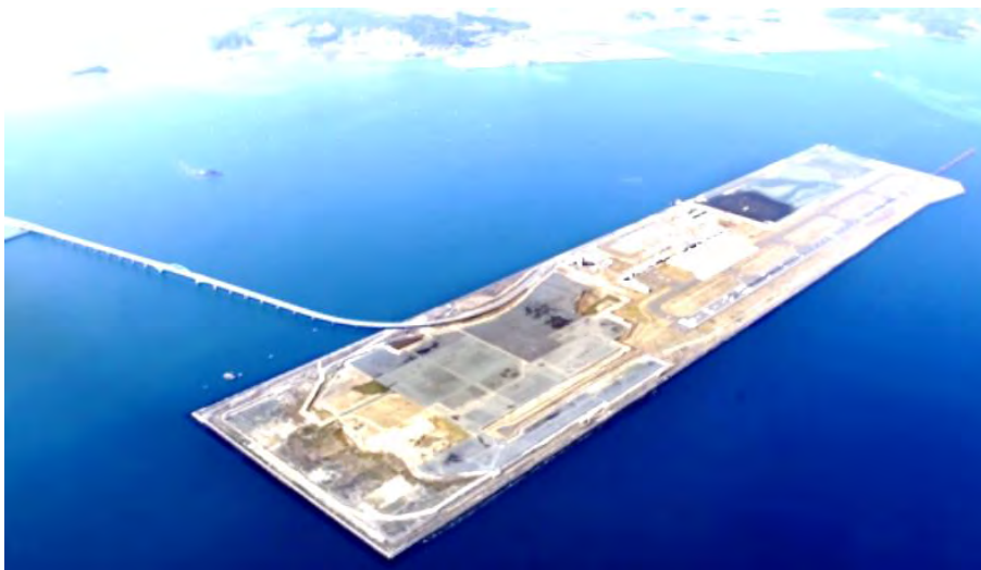
海上に浮かぶ北九州空港

工事が始まれば、滑走路が長くなるだけでなく、いずれ戦闘機や輸送機による離着陸訓練が始まることにもなる。