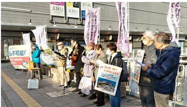
ギター伴奏付きで「さとうきび畑」を歌う「青い空合唱団9条の会」のみなさん

また、嬉しいのは、色々話しかけてもらえることです。いろんな方から、質問されたり励まされたりしています。今年3月の街頭宣伝では、当会加盟団体の「青い空合唱団9条の会」のみなさんが「さとうきび畑」を歌ってくれました。