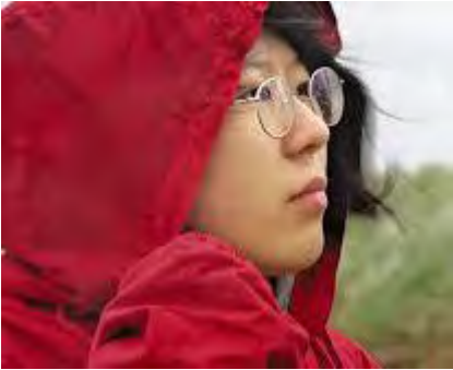
映画のワンシーンの菜の花さん