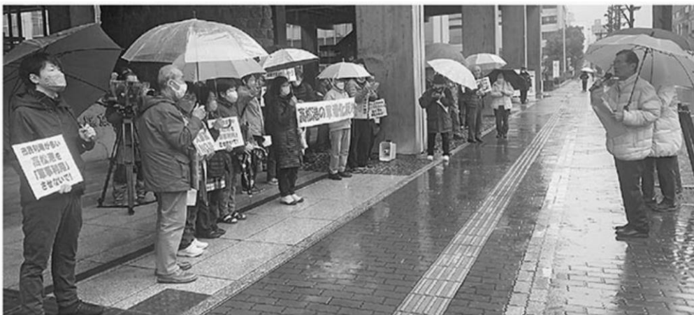
「高松港を軍港にするな」と、県庁前で抗議行動をする「明るい民主県政をきずく会香川県連絡会」のみなさん

また、高知港・須崎港・宿毛湾港が候補となっている高知県や、高松港が候補となっている香川県では、「指定されても同意しないよう」県に求める動きが広がっています。